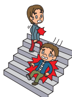
キャンパス内でのケガ