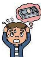
扶養者が事故で死亡し 授業料が払えなくなった