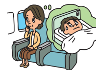
学生が入院し家族が駆け付けた