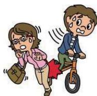
自転車で相手にケガをさせた