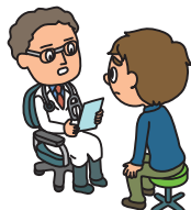
風邪をひいて通院した（1日目から対象）

加入される場合は、専用Webサイト（本ご案内の表面にも記載）からお申し込み下さい。